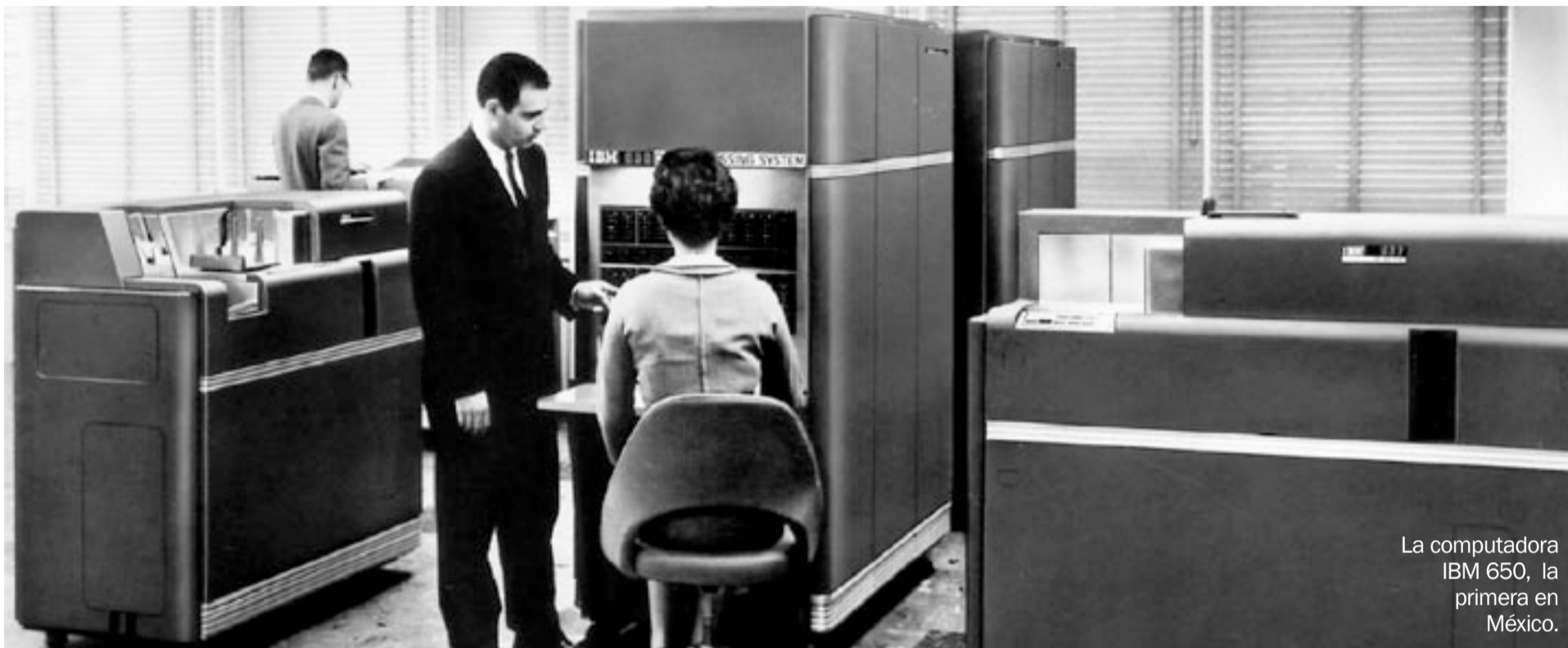
La computadora IBM 650, la primera en México.